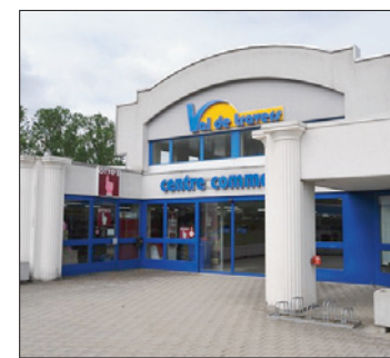
CENTRE COMMERCIAL Le prévenu a cambriolé l'un des magasins en juin.

L'homme ne conteste pas les faits, mais prétend être demeu-