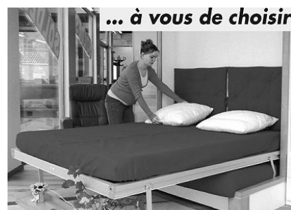
... à vous de choisir

par le plus moderne. Le tout dans des dimensions standard ou sur mesure, afin de satisfaire tous vos désirs.