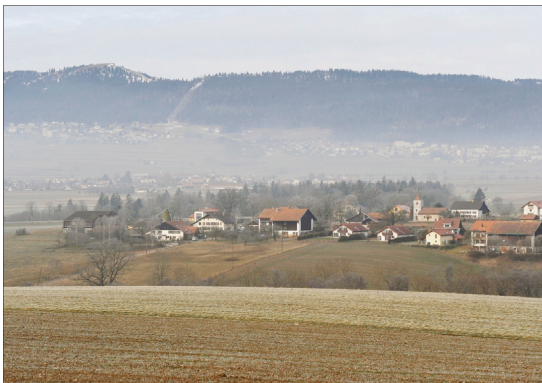
VAL-DE-RUZ Les Verts et l'UDC voient l'élection du Conseil communal de la future commune unique par le Conseil général comme un voile posé sur l'expression des droits populaires.